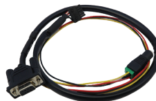
RS232 및 전원 케이블