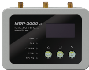
MRP-2000 v2 본체